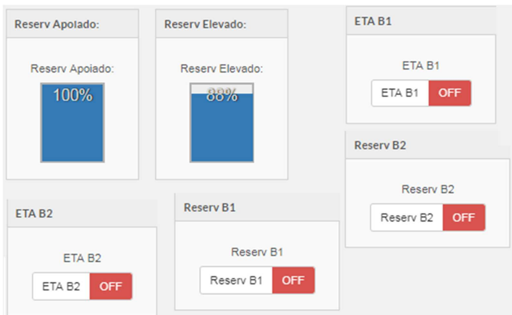
Figura 01 – Tela do Sistema Supervisor do Sistema de Brazabrantes – 15/08/2019

O SAA de Brazabrantes tem capacidade produtiva na Estação de Tratamento de Água de 14,00 L/s e outorga de 20,00 L/s, entretanto, no ano de 2019, a captação média foi de 6,64 L/s resultando num volume diário captado de 573,33 m 3 . Até o momento, esse manancial, apesar da redução da vazão, não comprometeu o abastecimento na sua área de abrangência. A Figura 01 retrata a tela do supervisor do SAA de Brazabrantes, onde é feito o monitoramento de todo o Sistema.